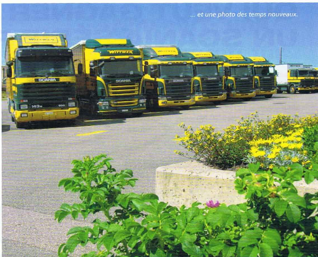
... et une photo des temps nouveaux.